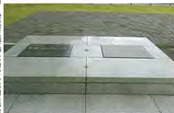
日本経緯度原点 (東京都港区)