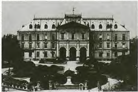
陸地測量部 (東京三宅坂)