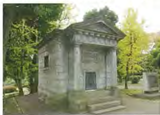
日本水準原点 (東京都千代田区)